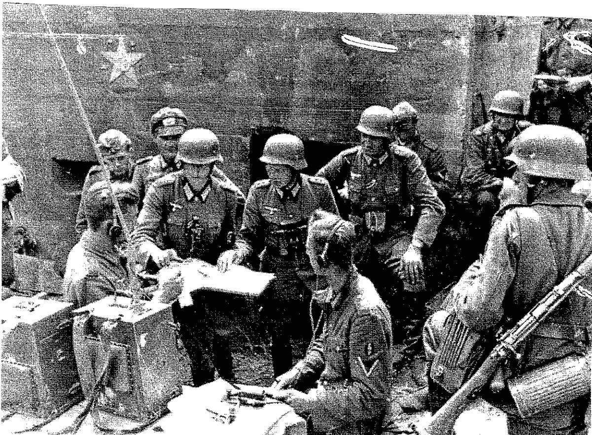
Deutsche Truppen 1944 in der Ukraine

Berdytschiw wurde erstmals 1320 als Siedlung erwähnt. Eine Stadt wurde hier um 1546 gegründet, später kam ein Schloss dazu. Seit 1675 fanden in Berdytschiw Jahrmärkte statt. In der Folge wurde die Stadt zu einem wichtigen Handelszentrum. Von 1892 bis 1921 verkehrte im Ort die mit Pferden betriebene Straßenbahn Berdytschiw.